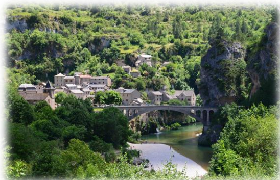
Village de la Malène