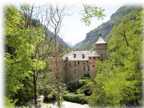
Château de Hauterives