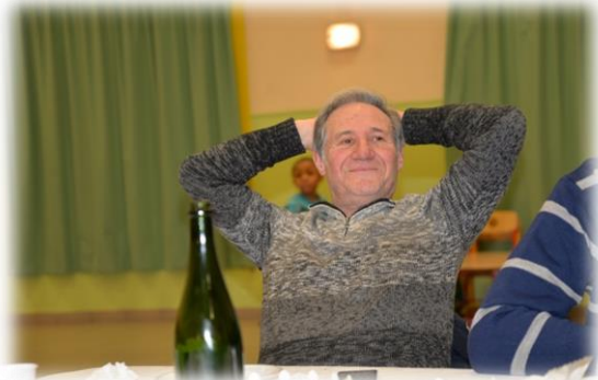
Moment de détente...